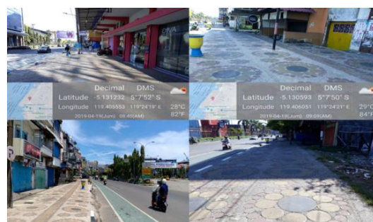
Gambar 4. Kondisi lokasi Penelitian Pusat Kuliner Jalan Nusantara Kota Makassar

Objek penelitian berada pada pinggiran kota Makassar tepatnya di Jalan Nusantara untuk dijadikan Pusat Kuliner Jalan Nusantara Kota Makassar, yang akan menempati pada koridor jalan utama kota tepatnya pada lokasi sarana hiburan, pelabuhan dan industri, dimana sistem dan pola aktifitas cukup kompleks, dan sebagai jalur pergerakan transportasi yang merupakan jalur utama dari dan masuk Tol Reformasi yang cukup tingkat serta perekonomian yang bergerak dilokasi penelitian bersifat formal dan non formal.